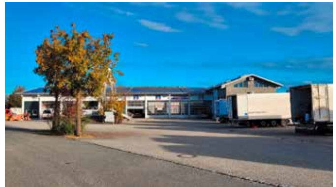
Foto: Auf diesem Betriebsgelände im Eiselfinger Gewerbering wird die Heizzentrale für das künftige Nahwärmenetz entstehen.

Die Gemeinde Eiselfing unterstützt das Projekt durch den Anschluss ihres bereits bestehenden kleinen Nahwärmenetzes rund um Schule, Kindergarten und Rathaus. Neu hinzukommen wird die bislang mit Heizöl versorgte Turnhalle – entsprechende Leitungen sind seit verganginem Jahr bereits im Pfarrer-Möderl-Weg verlegt. „Darüber hinaus